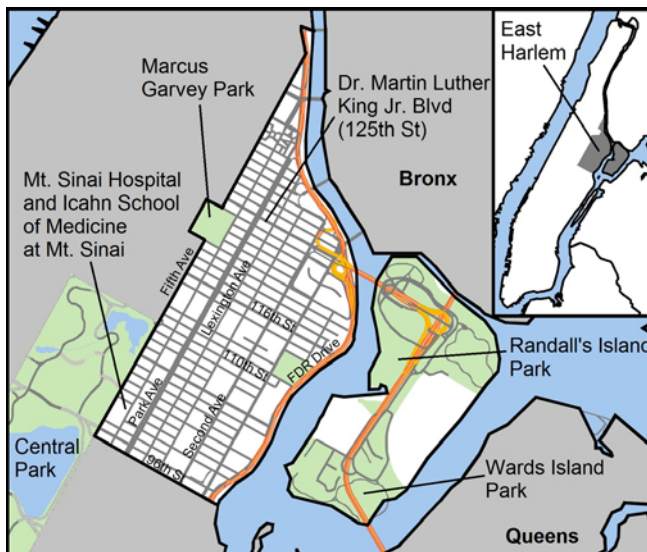
FIGURA 1 East Harlem

Restaurantes, tiendas de comestibles y muchos otros pequeños comercios se concentran a lo largo de corredores comerciales, incluidas las avenidas Segunda, Tercera y Lexington, y calles transversales como las calles 110 y 116.